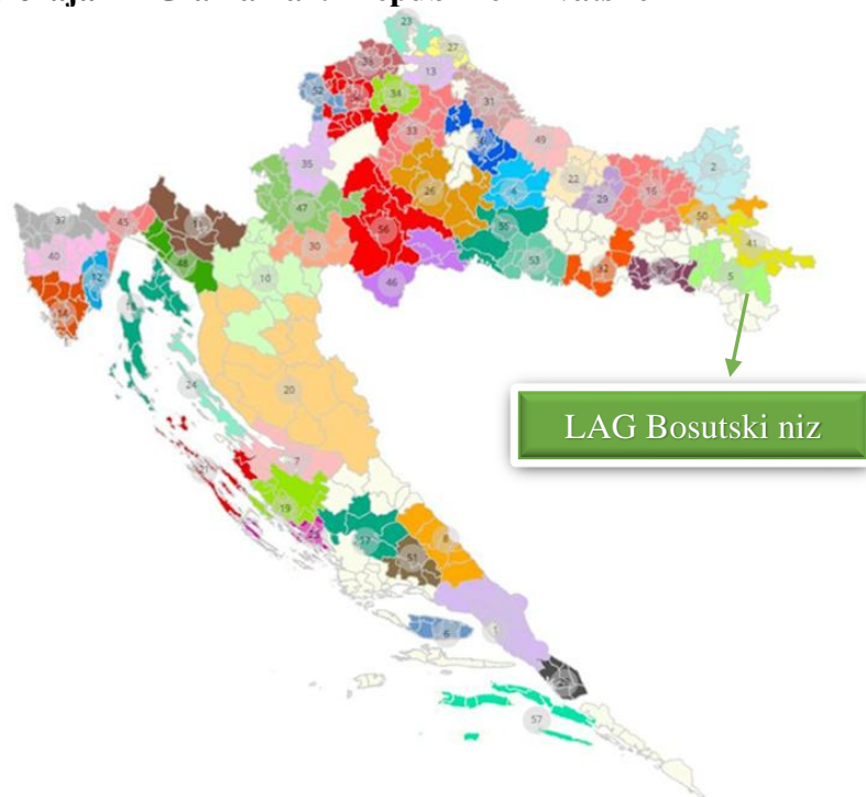
Slika 2: Karta položaja LAG-a na karti Republike Hrvatske