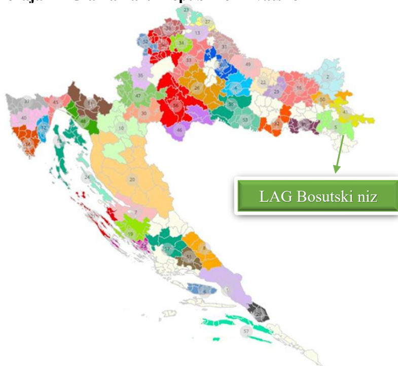
Slika 2: Karta položaja LAG-a na karti Republike Hrvatske